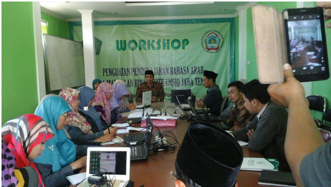
Workshop Penguatan Pembelajaran Bahasa Arab