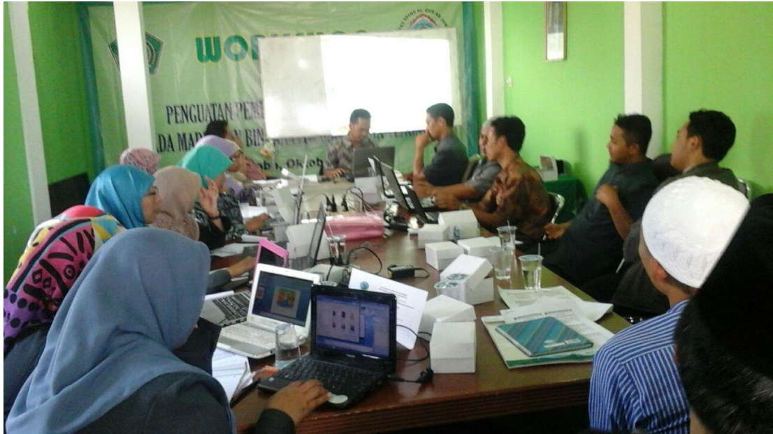
Workshop Penguatan Penguasaan IT Pembelajaran