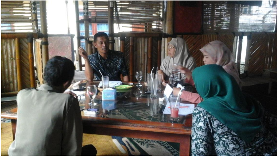
Rapat Koordinasi dengan MGMP Bahasa Arab