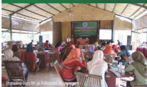
Upgrading Guru BK se-Kabupaten Pacitanegara

Program Pendidikan Islam Anak Usia Dini (PIAUD) bertujuan menyiapkan calon pendidik yang kreatif, berdedikasi dan profesional untuk membimbing dan membina anak-anak pada PAUD/TK/KB/RA. Output lulusan dipersiapkan untuk memenuhi kebutuhan guru di PAUD/TK/KB/RA, baik negeri maupun swasta dan menyandang gelar S.Pd.