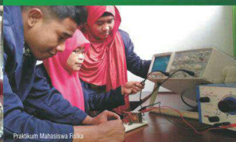
Praktikum Mahasiswa Fisika

Telah terakreditasi oleh BAN PT dengan SK nomor: 468/SK/BAN-PT/Akred/S/XII/2014. Program Pendidikan Fisika dipersiapkan untuk memenuhi kebutuhan Guru Mata Pelajaran IPA/Fisika pada tingkat SMP/SMA/SMK baik negeri maupun swasta. Output lulusan menyandang gelar S. Pd.