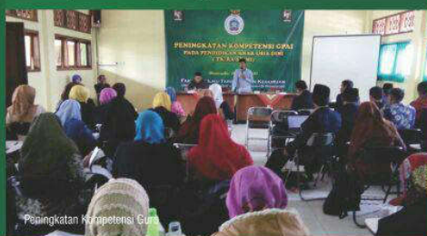
Peningkatan Kompetensi Guru

Pendidikan Agama Islam (PAI) telah terakreditasi oleh BAN PT sesuai dengan SK nomor: 0157/SK/BAN-PT/AK-XVI/S1/VII/2013. Program pendidikan Agama Islam dipersiapkan untuk memenuhi kebutuhan guru PAI dan mata pelajaran keagamaan pada jenjang SD/MI/SMP/MTs/SMA/MA/SMK, baik negeri maupun swasta. Output lulusan menyandang gelar S.Pd.