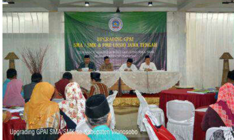
Upgrading GPAI SMA/SMK se-Kabupaten Wonosobo

PENERIMAAN MAHASISWA BARU FAKULTAS ILMU TARBİYAH DAN KEGURUAN TAHUN AKADEMIK 2017/2018