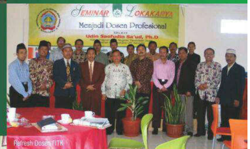
Refresh Dosen FITK